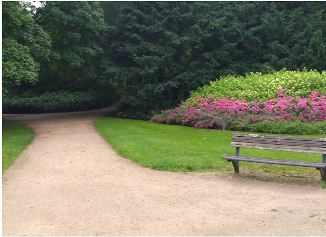
Formeel halfverhard wandelpad