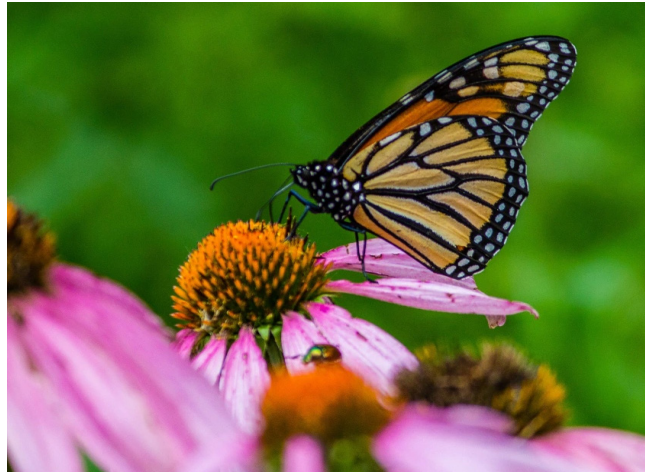
Insectentuin / educatie en beleving