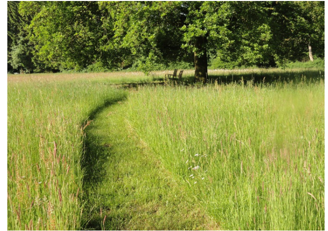
Informeel wandelpad (intensief en extensief gemaaid gras of bloem- en kruidenrijk grasland)