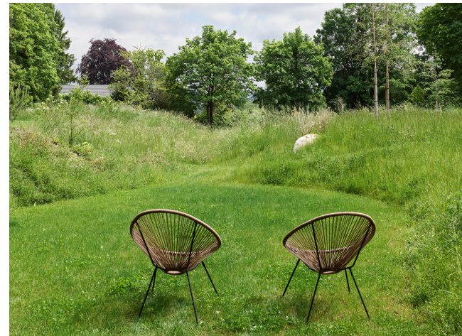
Verblijven in het groen