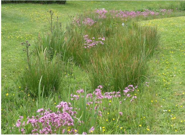
Impressie groene inpassing