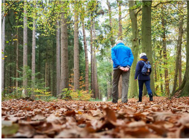
Wandelen / bewegen