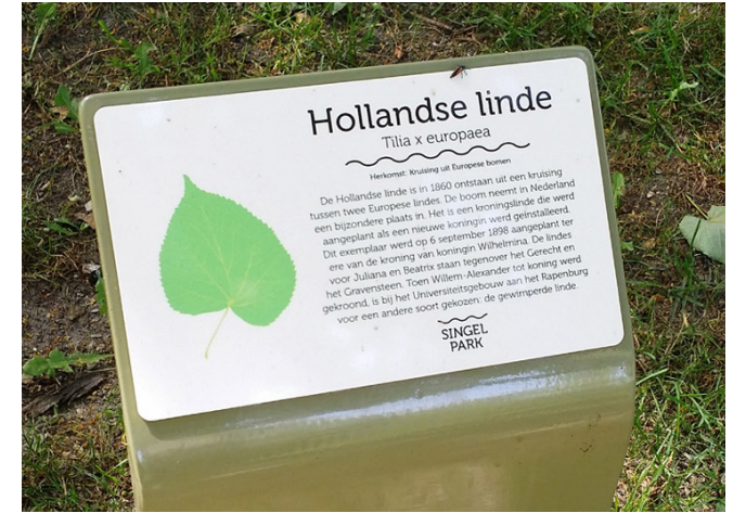
naambordjes / educatie