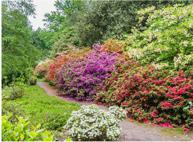
Borders met inheemse beplanting