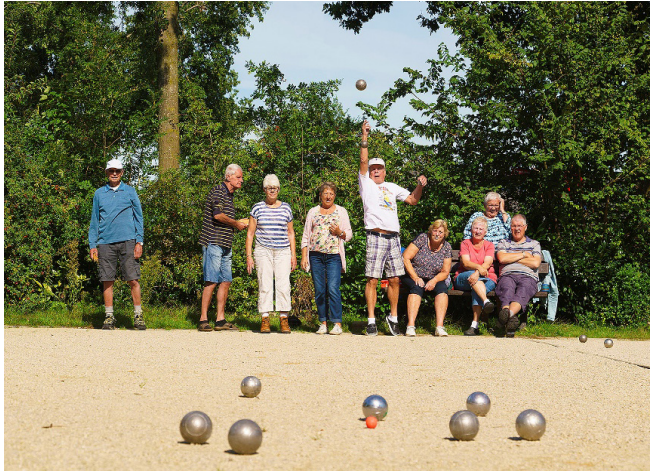
jeu de boules