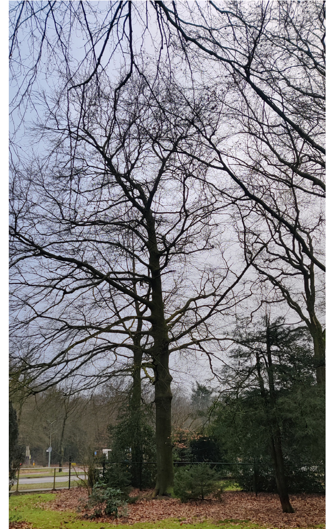
Beeldbepalende bomen behouden