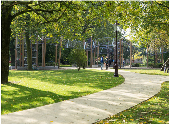
Formeel halfverhard wandelpad, inheemse naald- en loofbomen