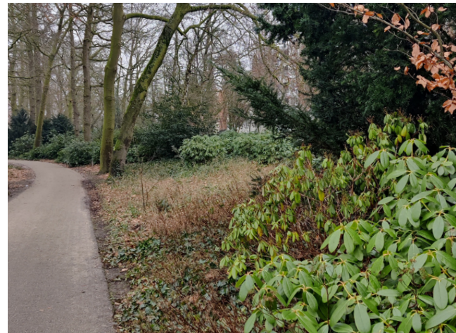
Haag of struweel