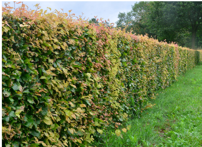
Haag of struweel